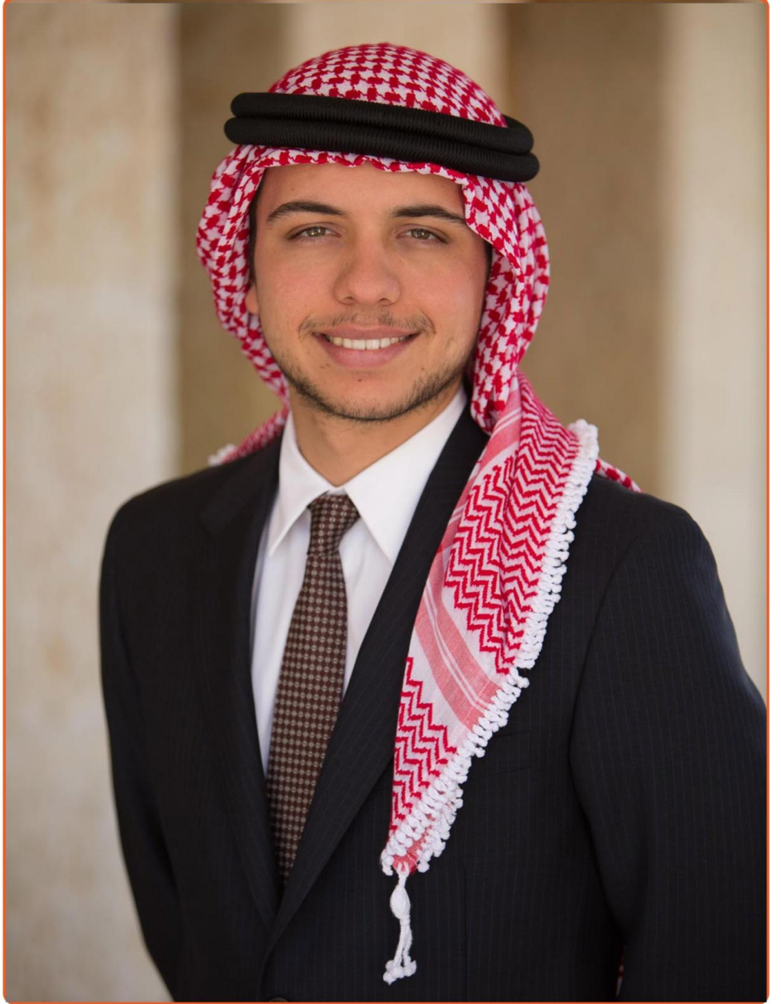
ولي العهد صاحب السمو الملكي الامير الحسين بن عبد الله الثاني بن الحسين المعظم