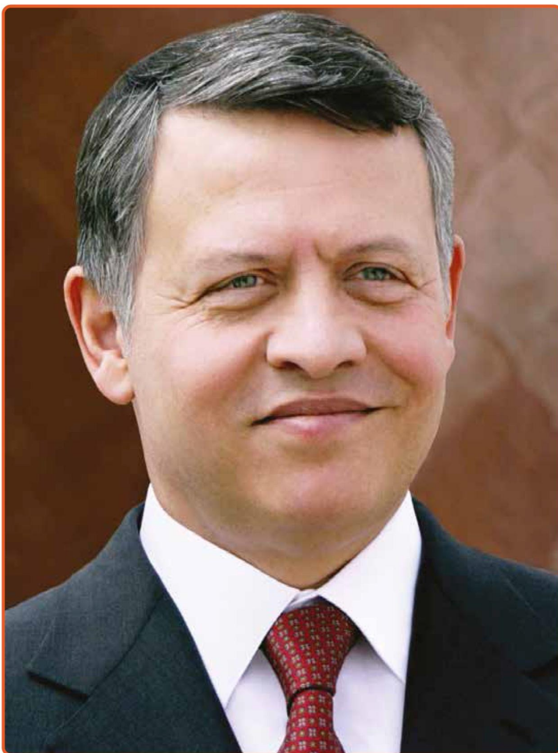
صاحب الجلالة الملك عبد الله الثاني بن الحسين المعظم