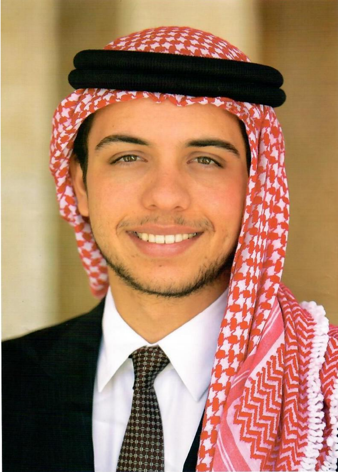
سمو الأمير حسين بن عبد الله الثاني ولي العهد المعظم