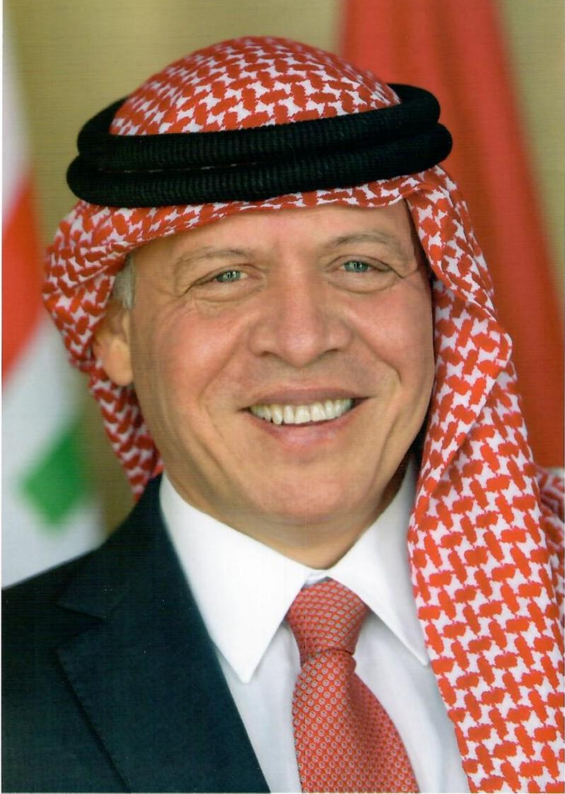
حضرة صاحب الجلالة الهاشمية الملك عبد الله الثاني بن الحسين المعظم