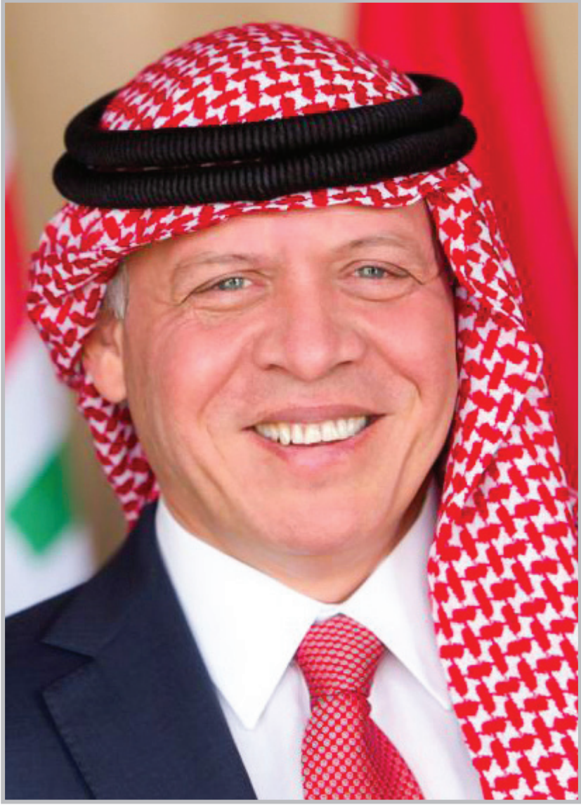
حضرة صاحب الجلالة الملك عبد الله الثاني بن الحسين المعظم