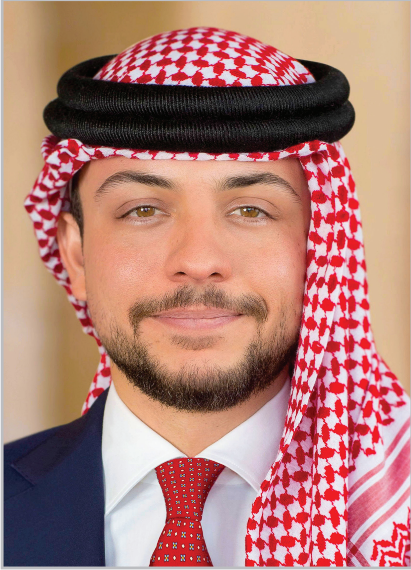
حضرة صاحب السمو الملكي الأمير الحسين بن عبد الله الثاني ولي العهد المعظم