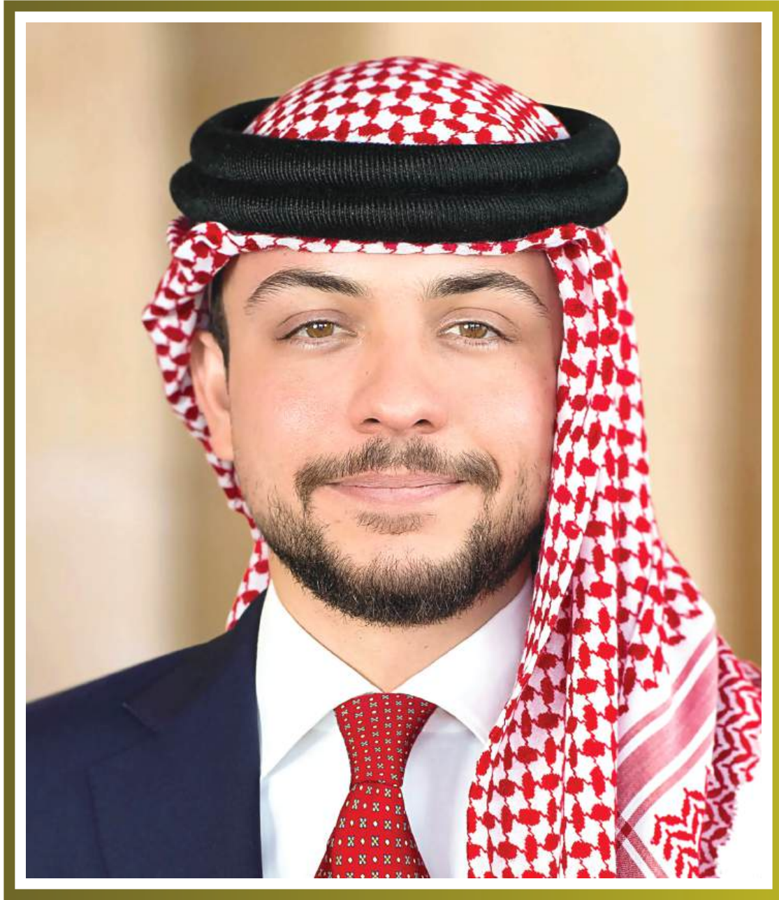
صاحب السمو الملكي الأمير الحسين بن عبدالله الثاني ولي العهد المعظم حفظه الله