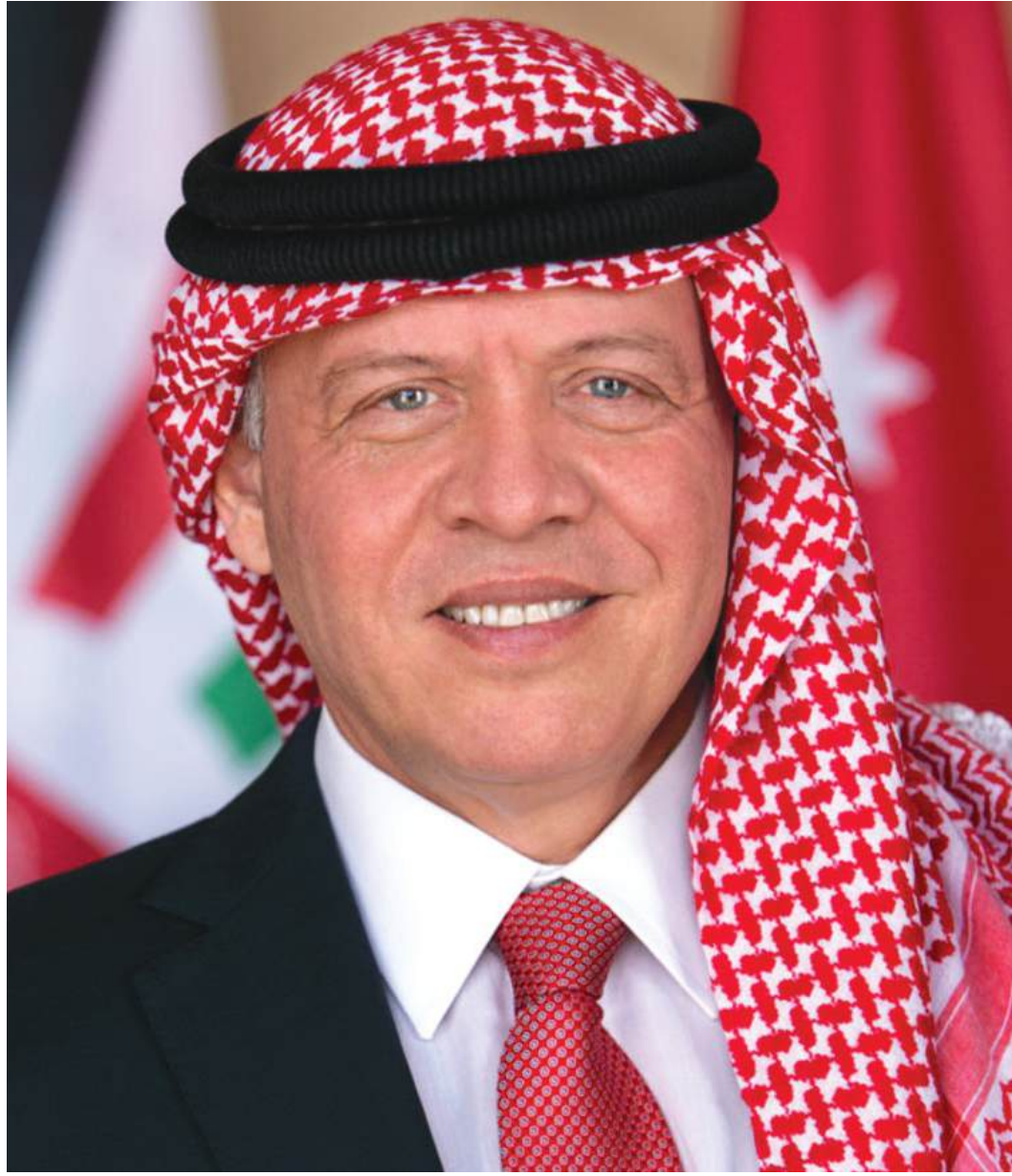
حضرة صاحب الجلالة الهاشمية الملك عبدالله الثاني ابن الحسين المعظم حفظه الله