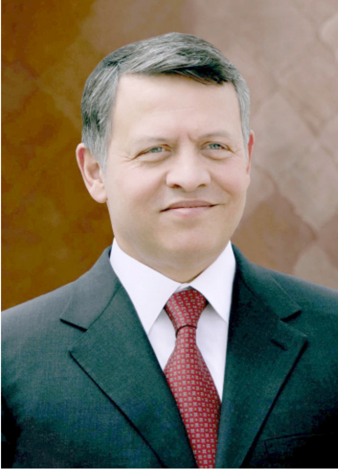
حضرة صاحب الجلالة الملك عبدالله الثاني بن الحسين حفظه الله و رعاه