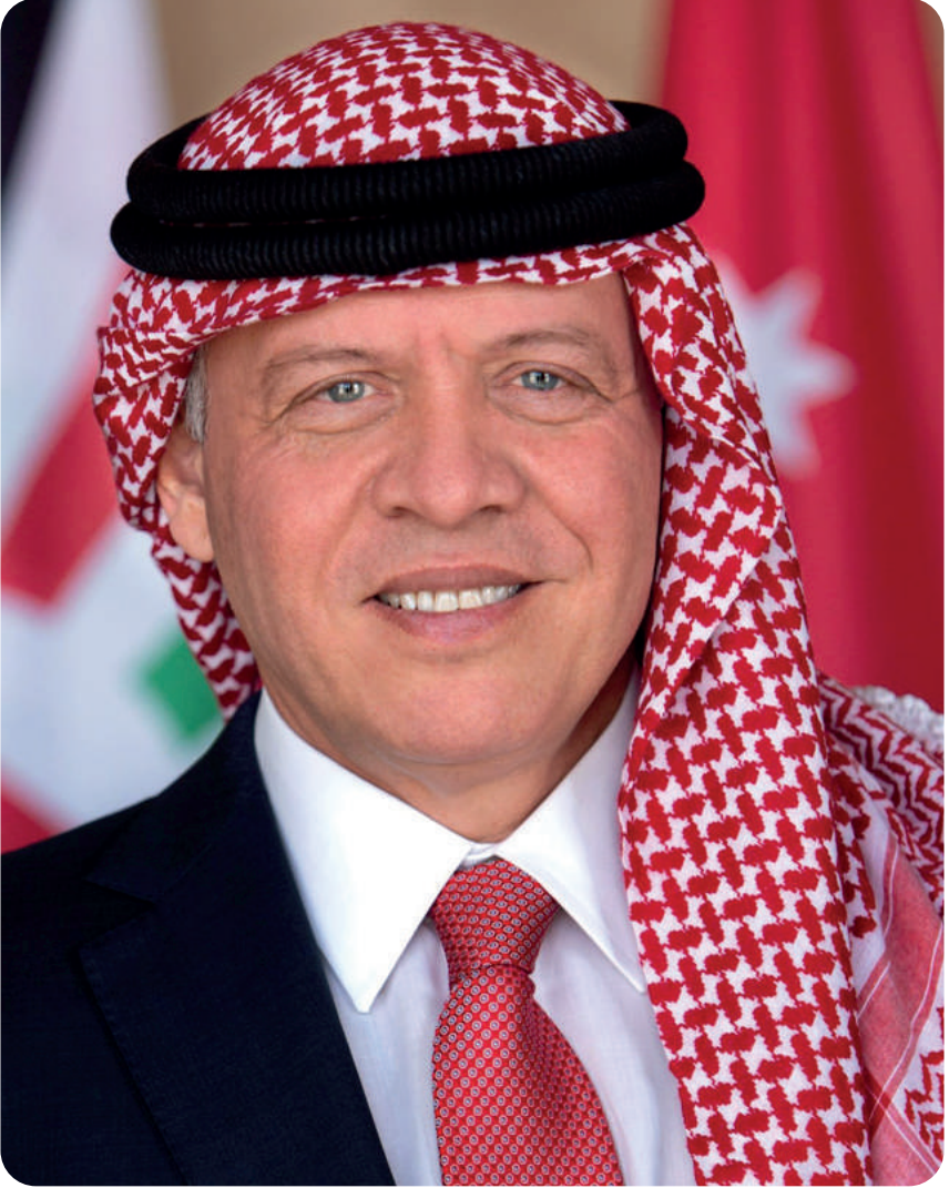
جلالة الملك عبد الله الثاني بن الحسين المعظم