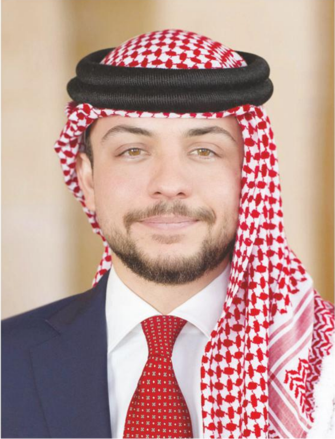
ولي العهد صاحب السمو الملكي الأمير الحسين بن عبدالله الثاني المعظم