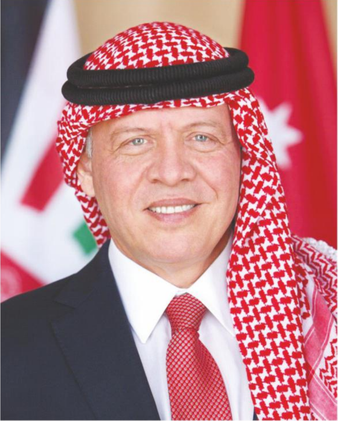
حضرة صاحب الجلالة الهاشمية الملك عبد الله الثاني بن الحسين المعظم