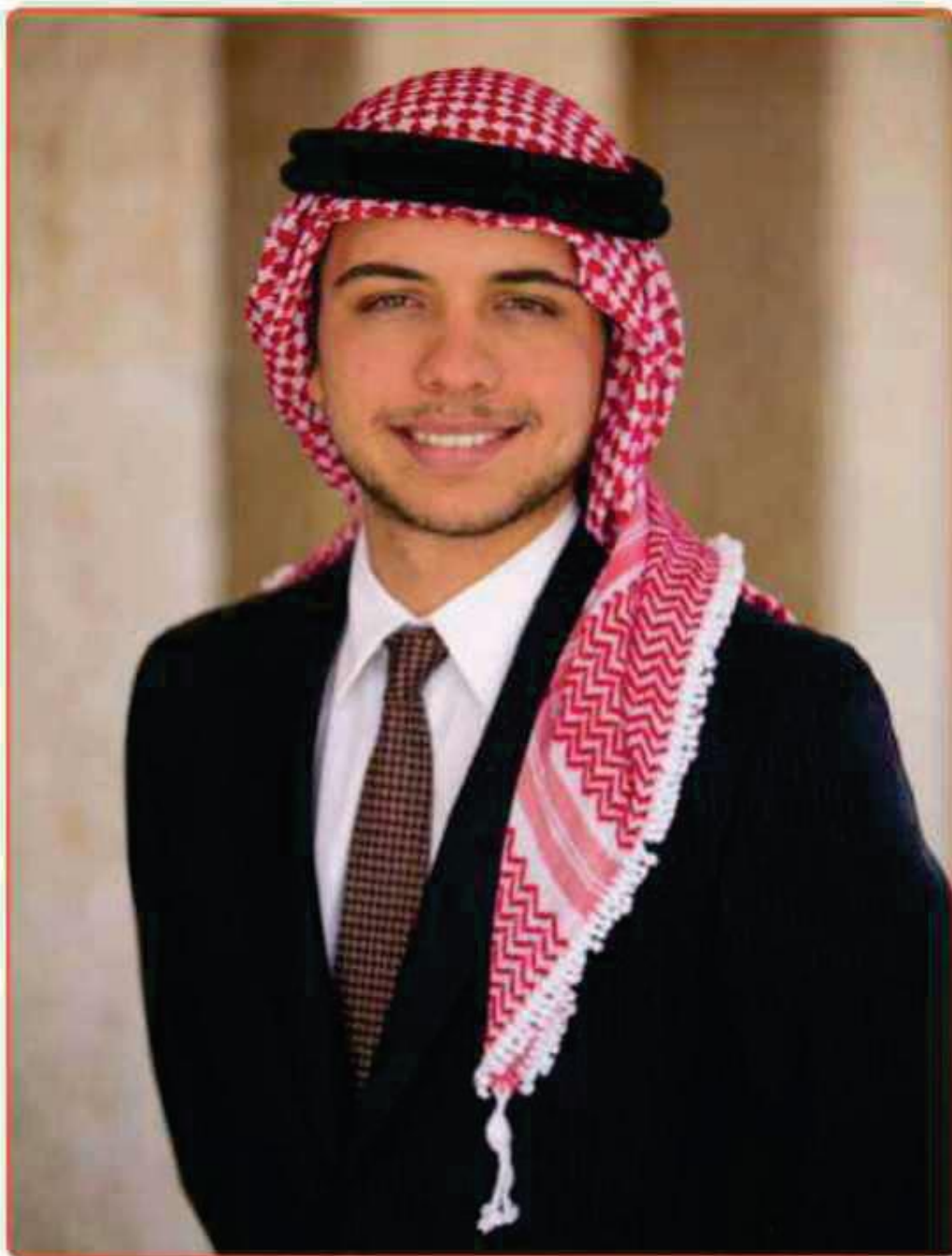
ولي العهد صاحب السمو الملكي الأمير الحسين بن عبد الله الثاني بن الحسين المعظم