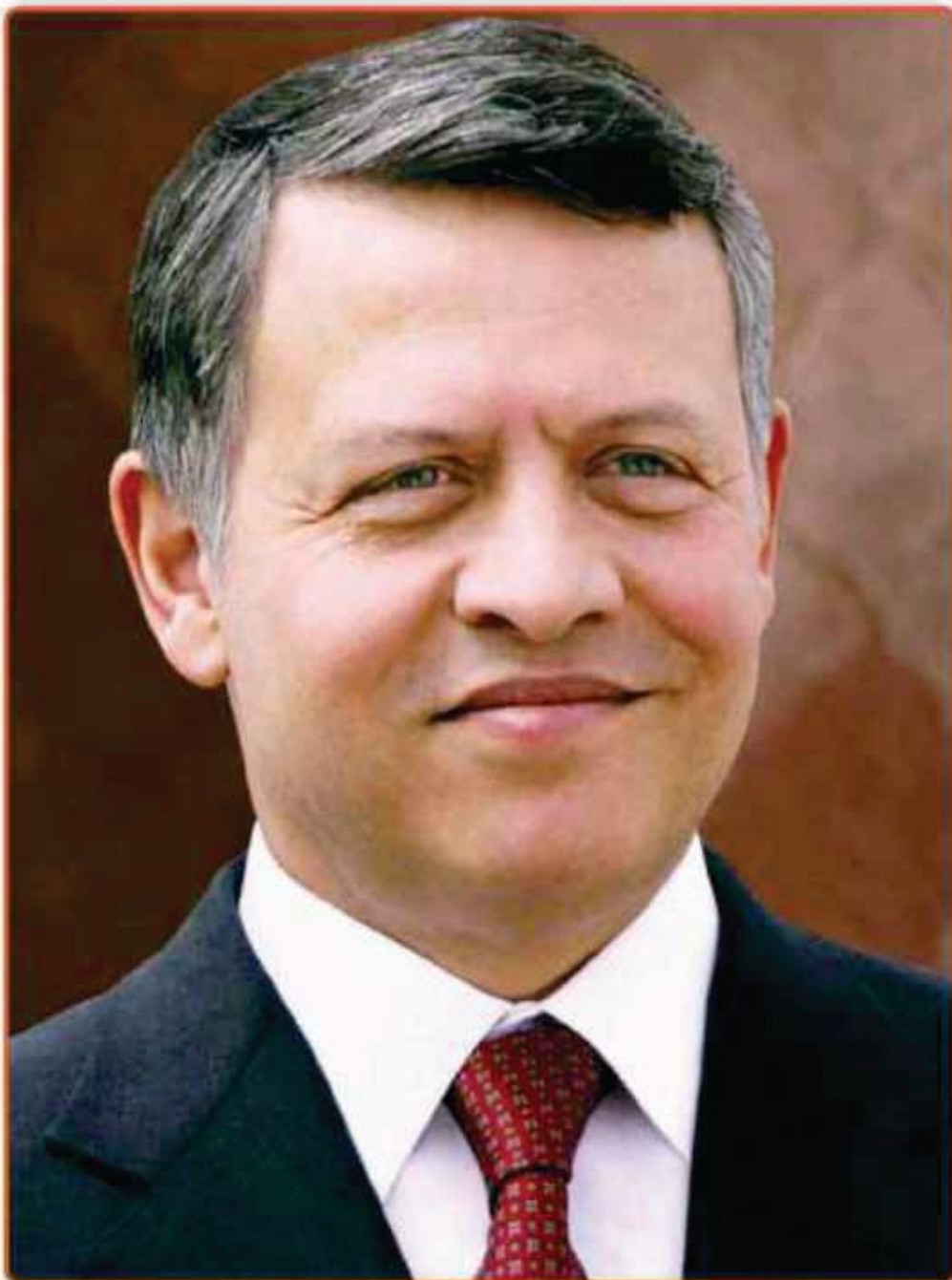
صاحب الجلالة الملك عبد الله الثاني بن الحسين المعظم