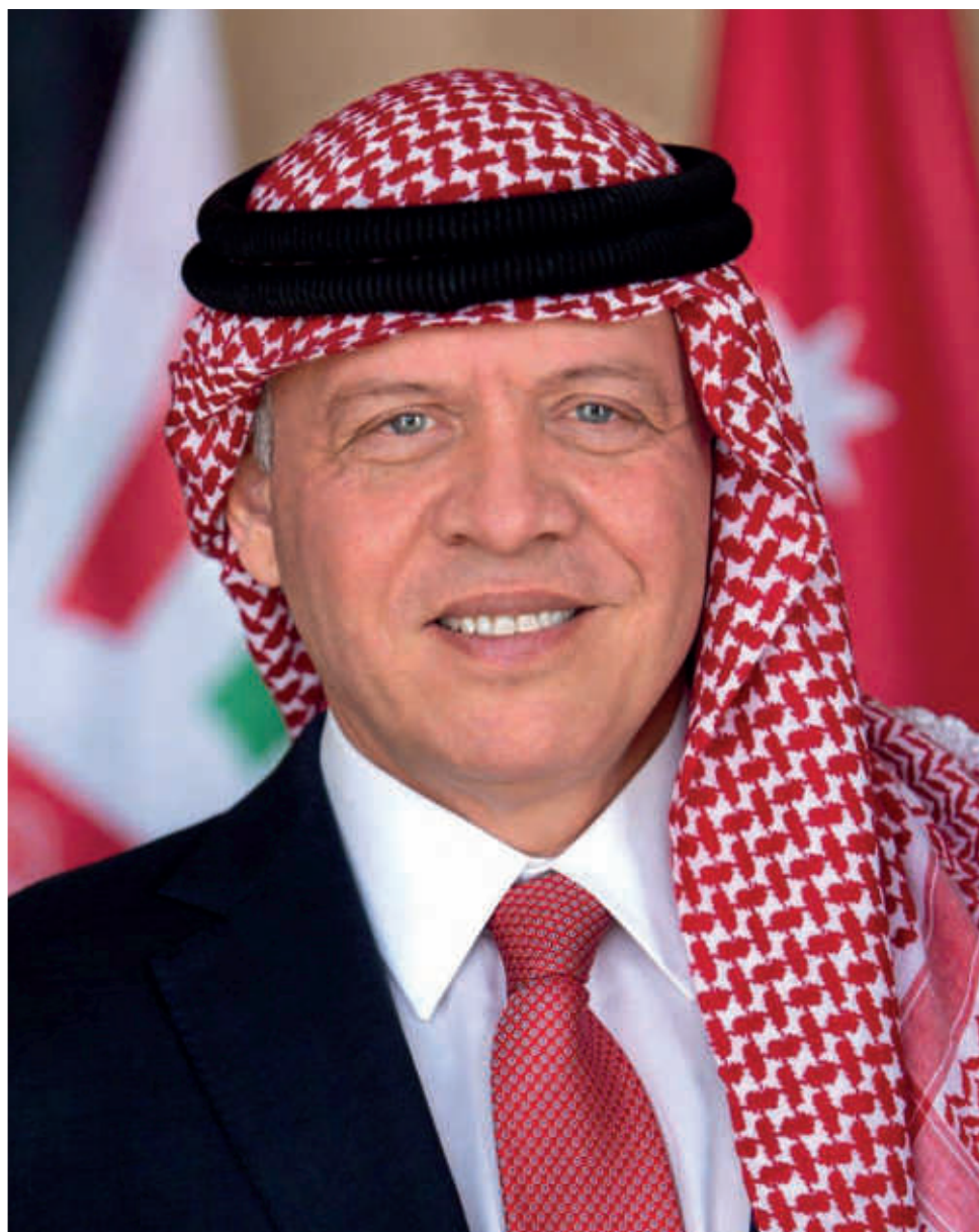
His majesty king Abdullah II Bin Al Hussein