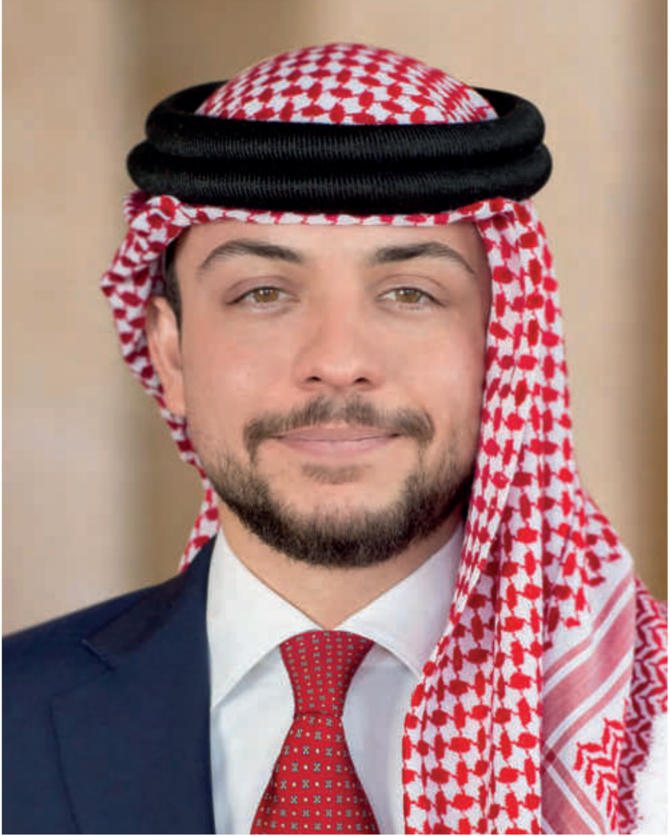
ولي العهد الامير حسين بن عبدالله الثاني