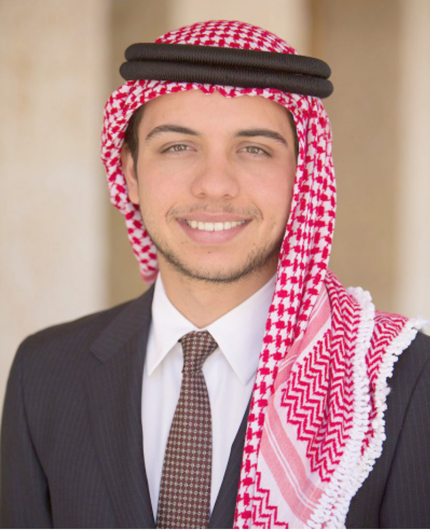
حضرة ولي العهد الحسين بن عبدالله الثاني حفظه الله و رعاه