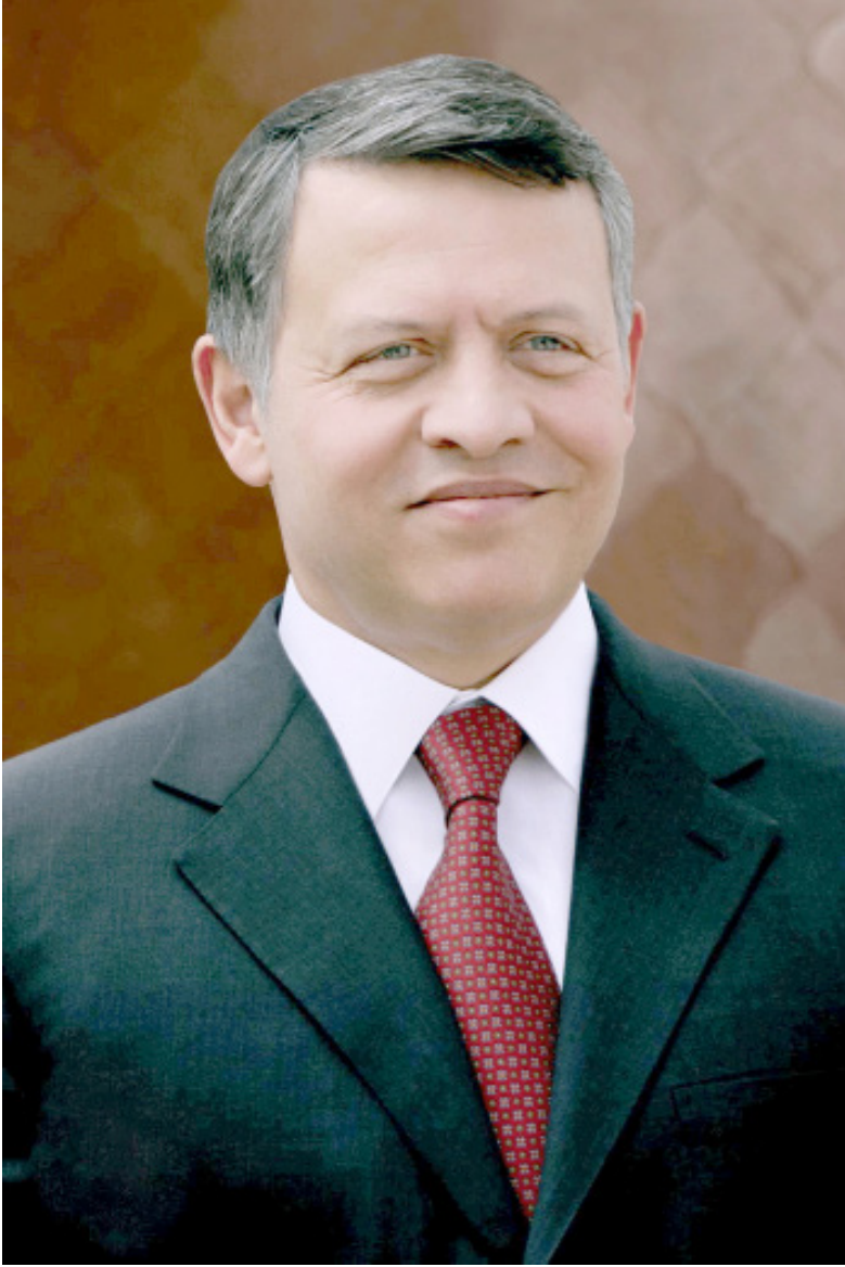
حضرة صاحب الجلالة الملك عبد الله الثاني بن الحسين حفظه الله ورعاه