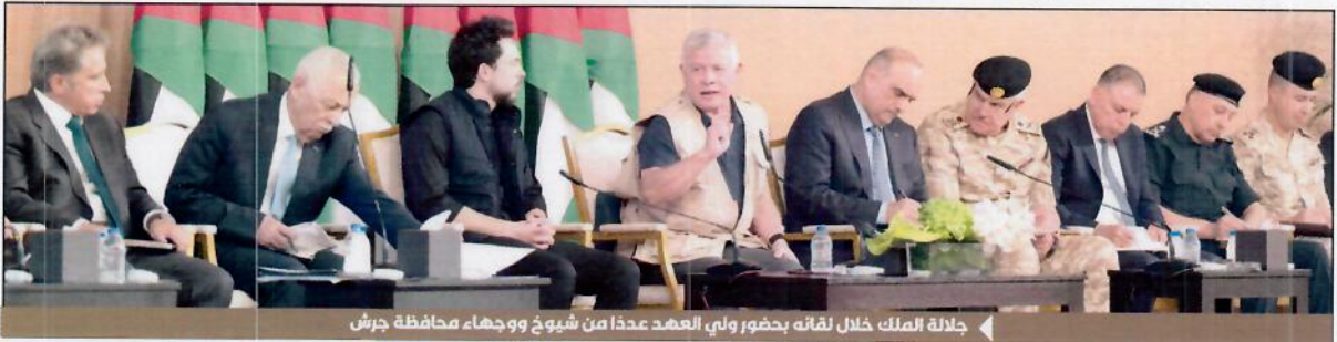
جلالة الملك خلال لقائه بحضور ولي العهد عددا من شيوخ ووجهاء محافظة جرش