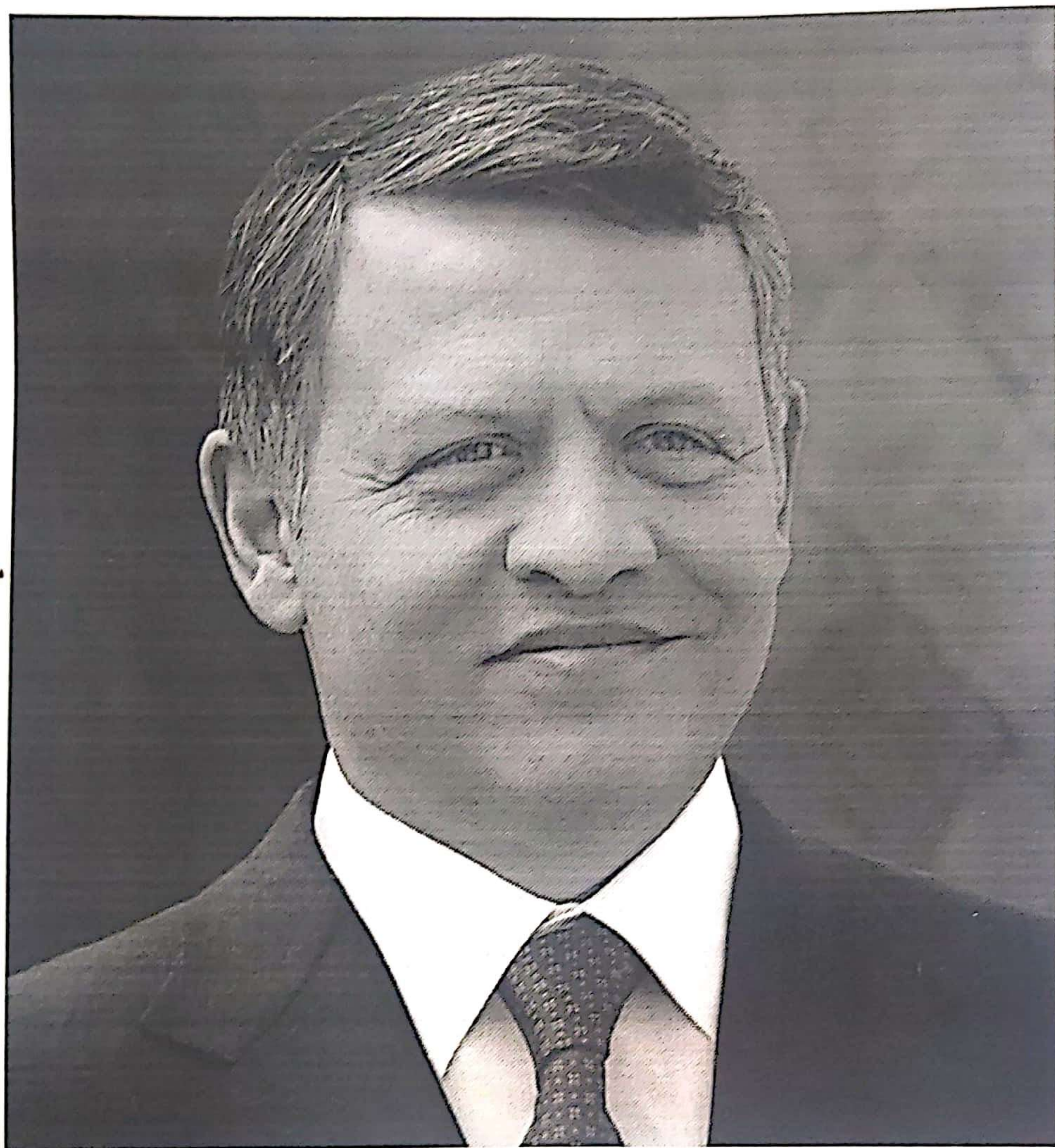
صاحب الجلالة الملك عبد الله بن الحسين المعظم