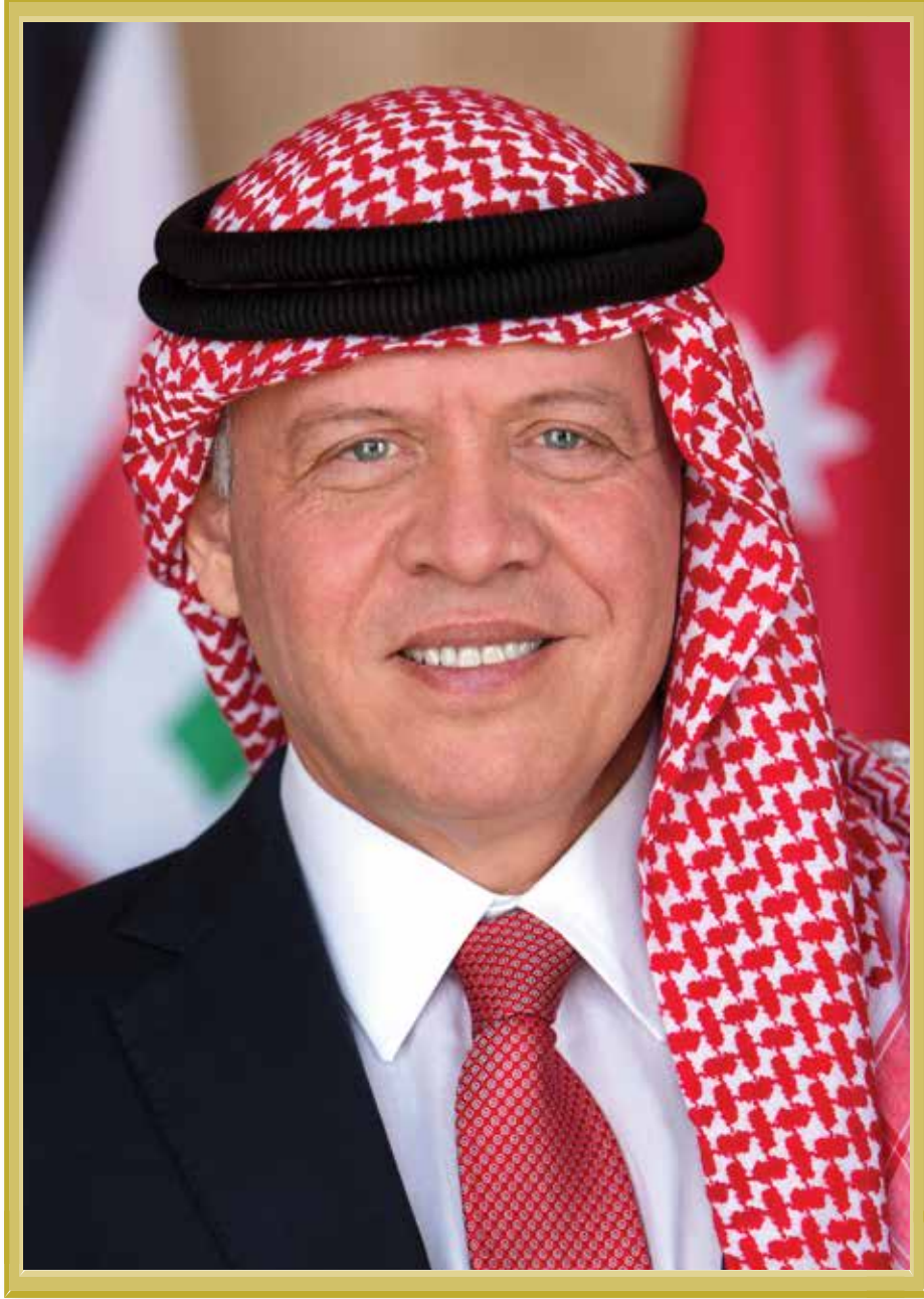
حضرة صاحب الجلالة الملك عبدالله الثاني ابن الحسين المعظم