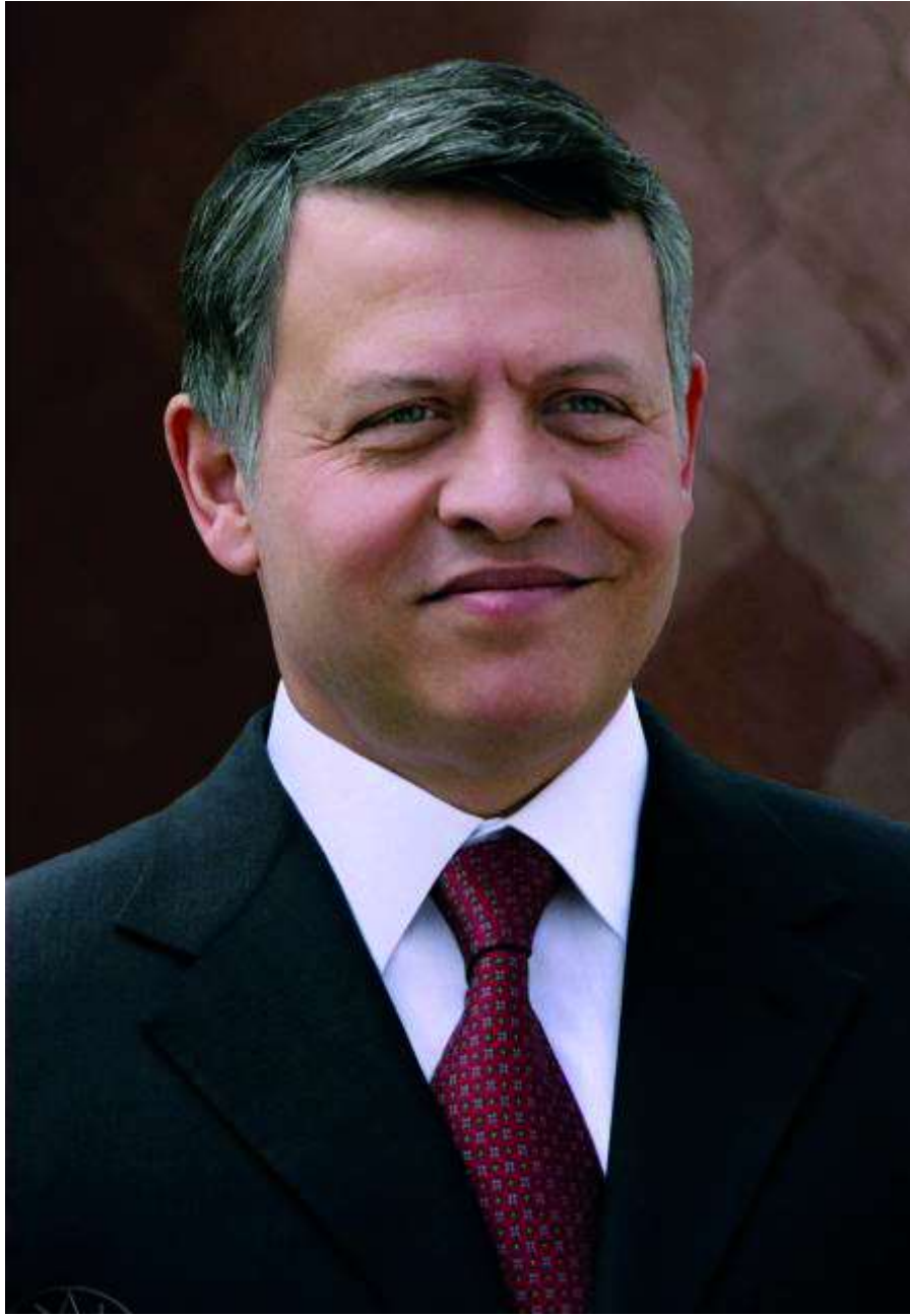
حضرة صاحب الجلالة الملك عبد الله الثاني بن الحسين