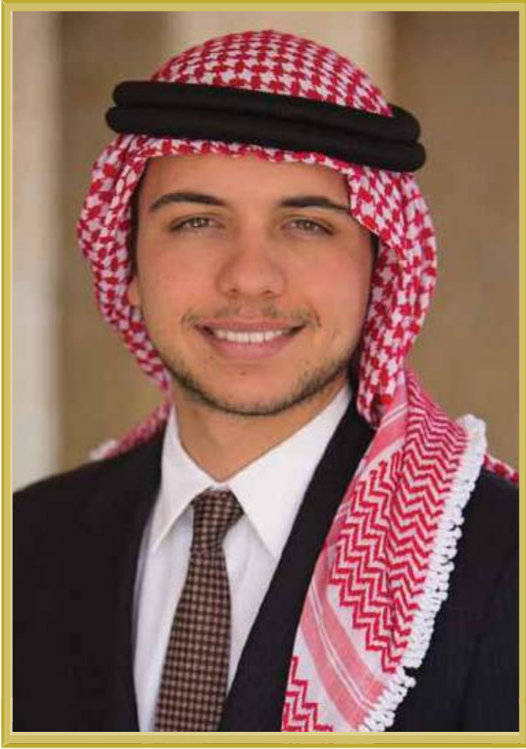
ولي العهد الأمير حسين ابن عبدالله الثاني