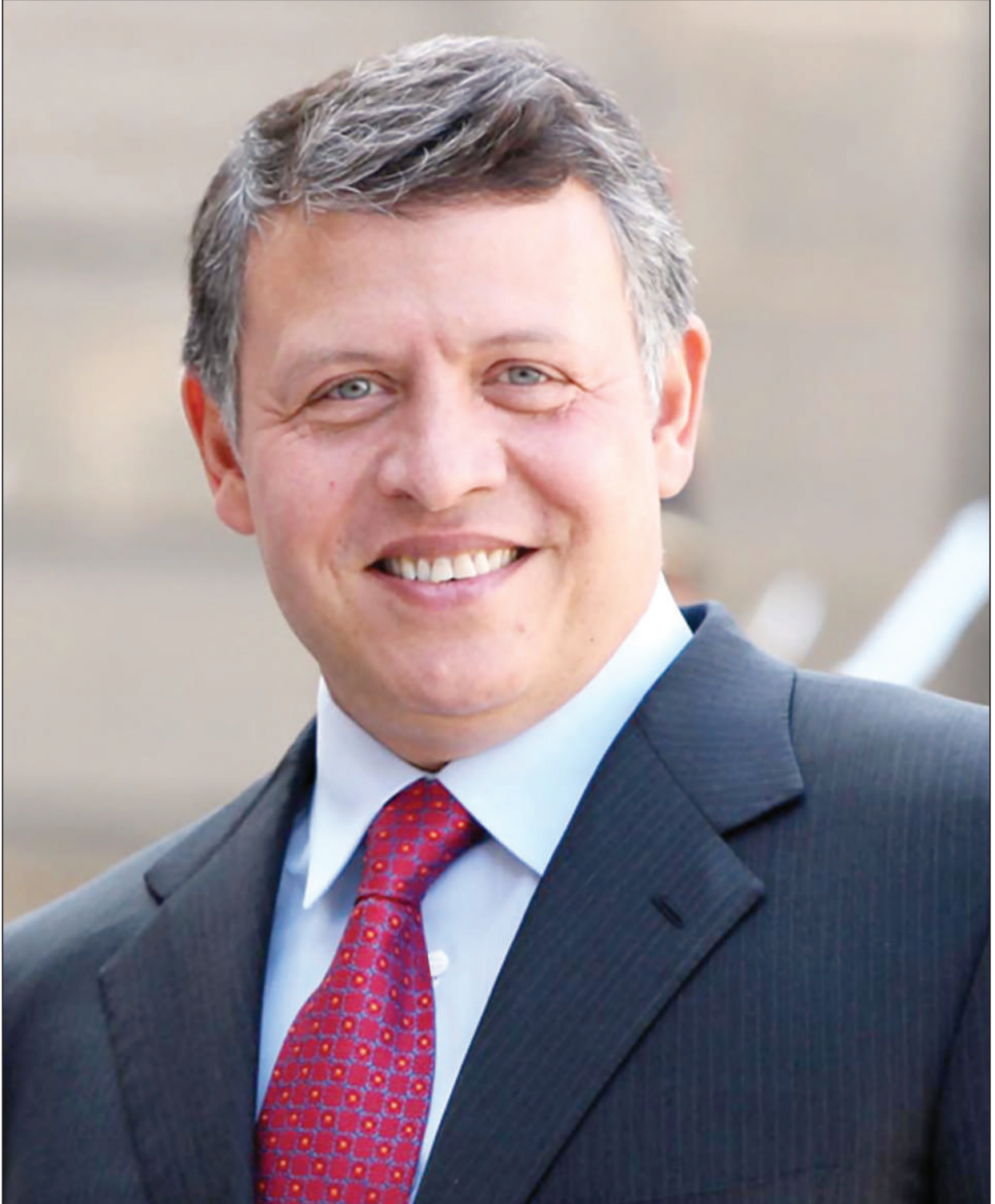
حضرة صاحب الجلالة الملك عبدالله الثاني ابن الحسين المعظم