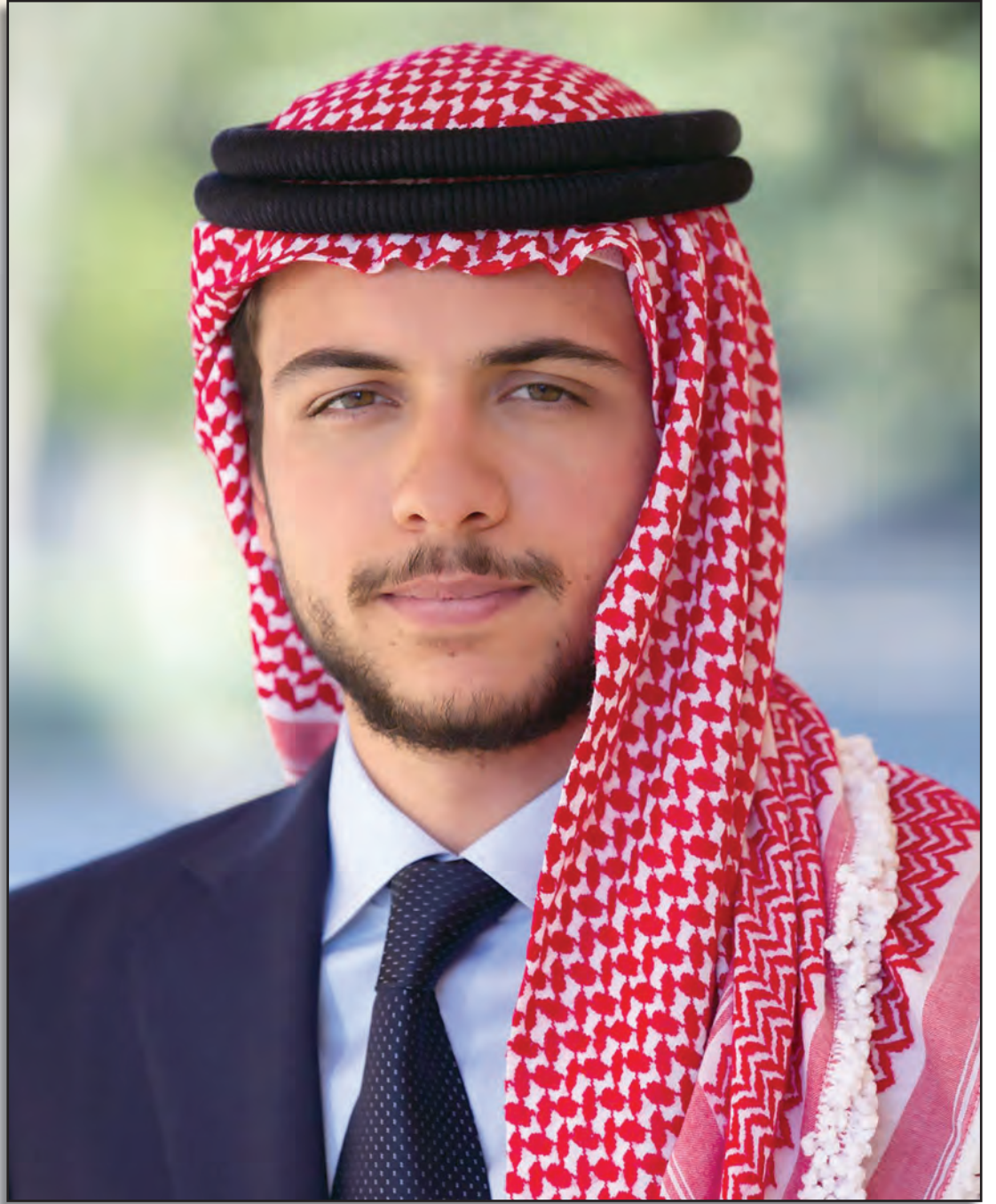
سمو ولي العهد الأمير حسين بن عبدالله الثاني المعظم