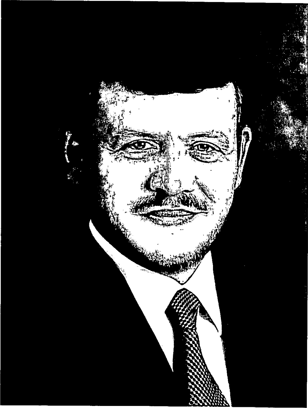
حضرة صاحب الجلالة الهاشمية الملك عبد الله الثاني بن الحسين المعظم