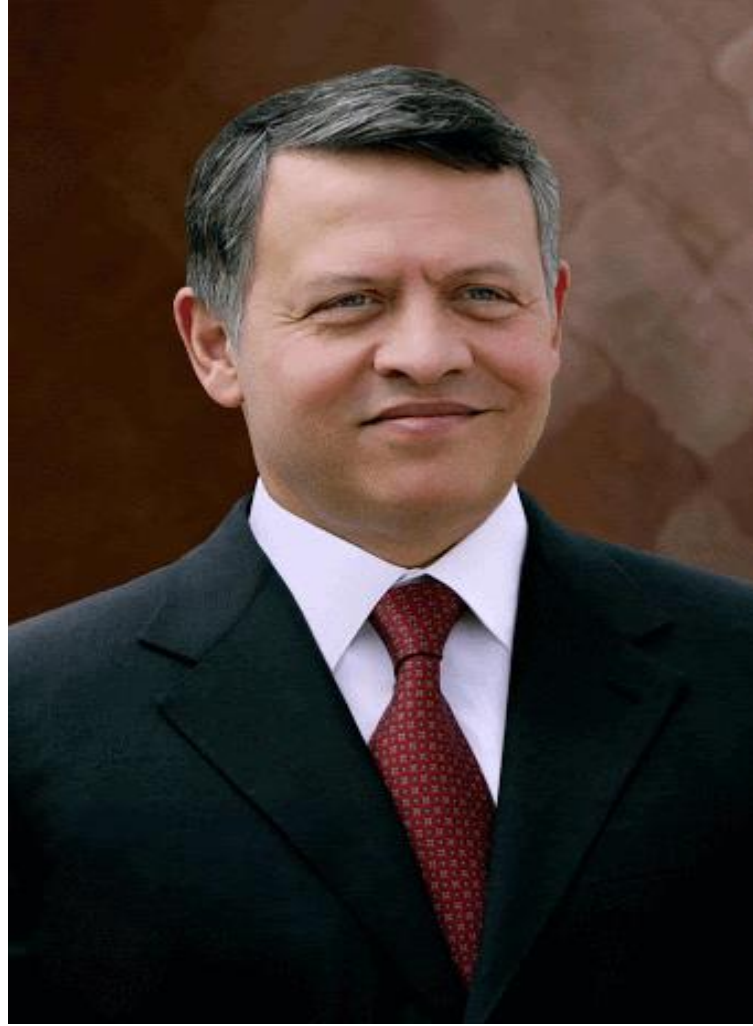
جلالة الملك عبدالله الثاني بن الحسين المعظم