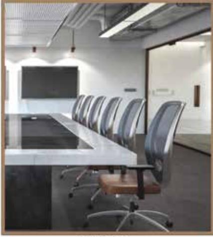
مجلس إدارة الشركة