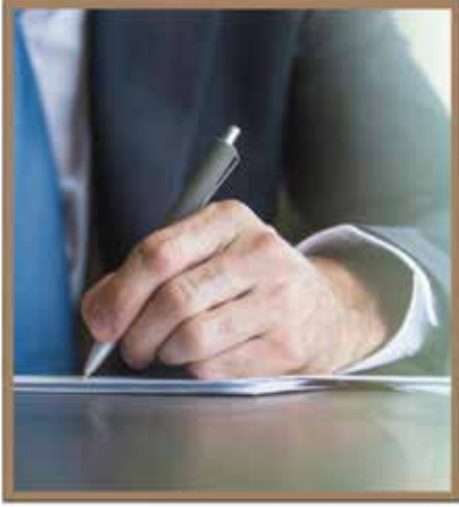
تقرير مجلس الإدارة

يسر مجلس إدارة شركة الأولى للتمويل أن يقدم لحضراتكم تقريره السنوي التاسع عشر عن أعمال الشركة وأنشطتها والقوائم المالية للسنة المنتهية في ٣١ كانون الأول ٢٠٢٥ وأهم تطلعاتها المستقبلية للعام ٢٠٢٦. تأسست شركة الأولى للتمويل كشركة مساهمة عامة محدودة تمارس جل أنشطتها وفق أحكام الشريعة الإسلامية الغراء، وسجلت تحت رقم (٣٩٠) بتاريخ ٢٠٠٦/٣/٥، واستناداً لقانون الأوراق المالية رقم ٧٦ لسنة ٢٠٠٢ وتطبيقاً للمادة ٤ من تعليمات الإفصاح واسترشاداً بدليل إعداد التقارير السنوية للشركات المساهمة العامة نورد ما يلي: