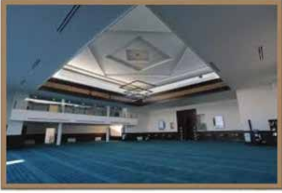
هيئة الفتوى والرقابة الشرعية