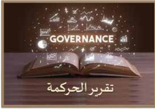
تقرير الحوكمة للعام 2025