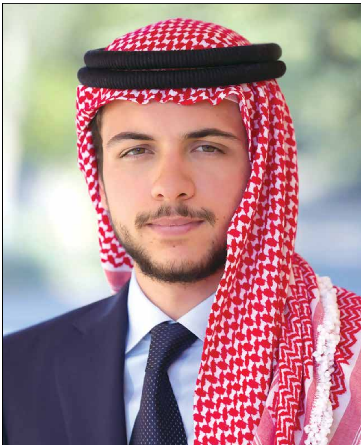
حضرة صاحب السمو الملكي الأمير حسين ابن عبدالله الثاني ولي العهد