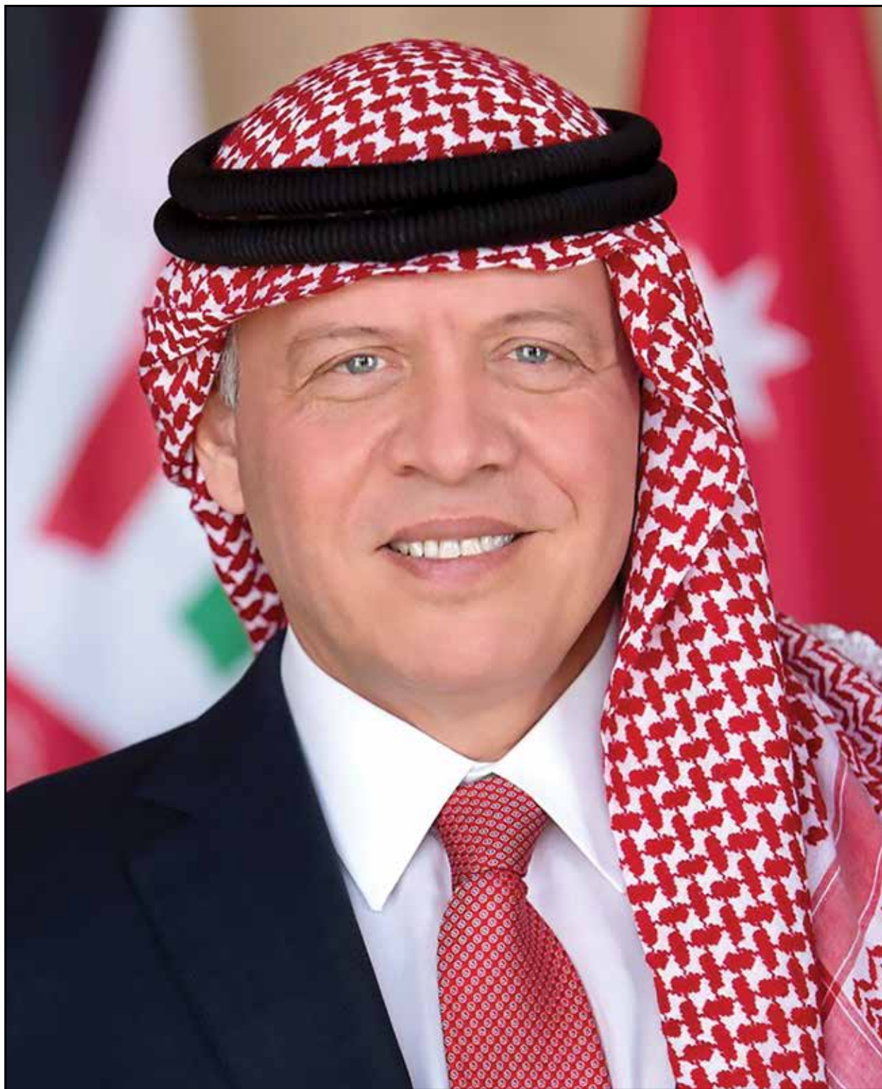
حضرة صاحب الجلالة الملك عبدالله الثاني ابن الحسين المعظم