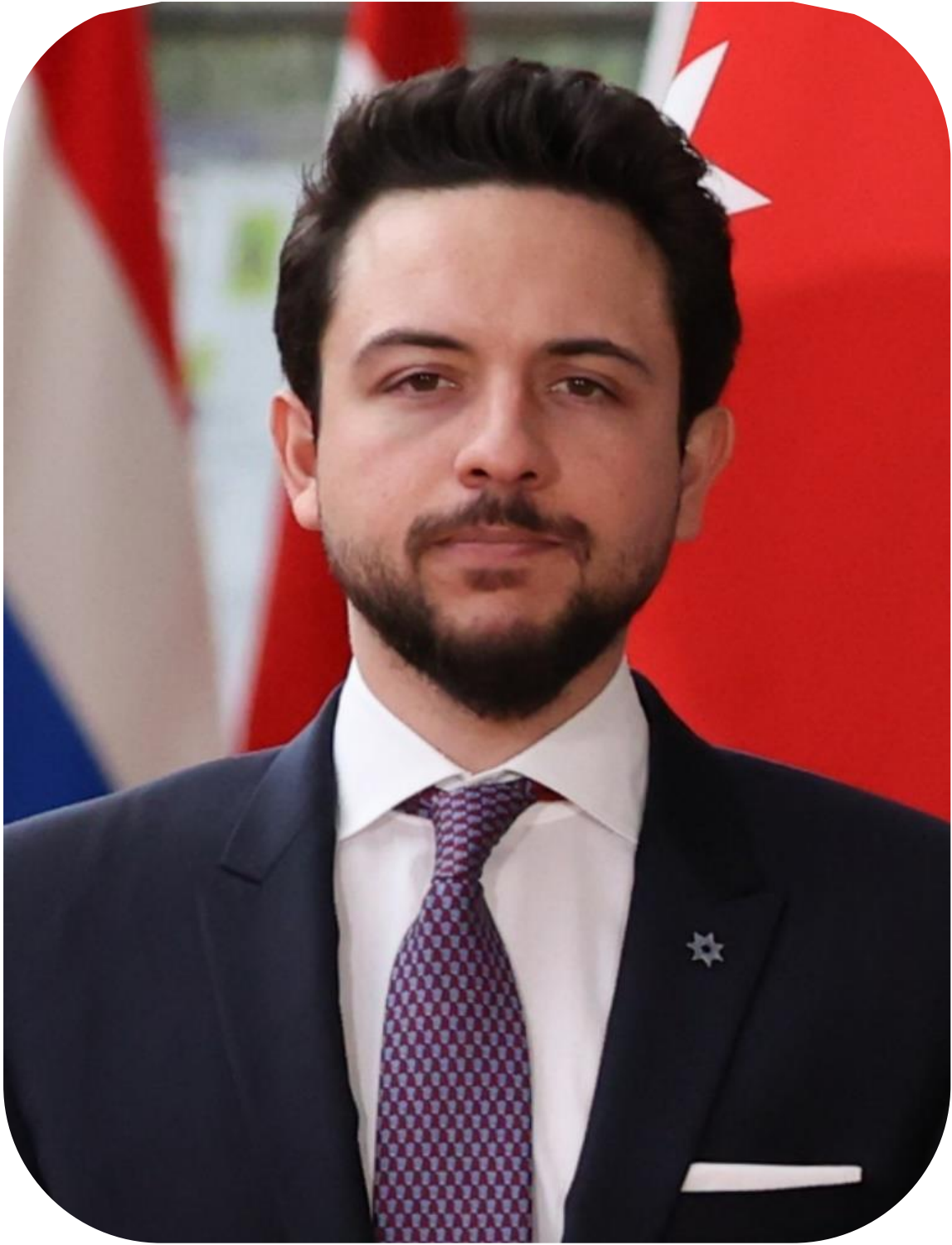
حضرة صاحب السمو الملكي ولي العهد الأخير الحسين بن عبد الله الثاني المعظم