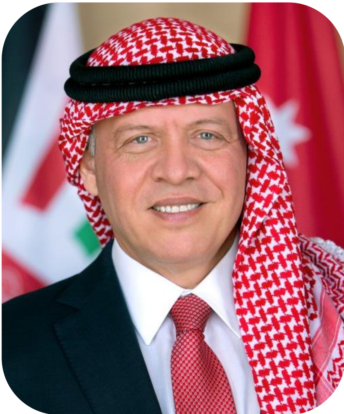
حضرة صاحب الجلالة الهاشمية الملك عبد الله الثاني بن الحسين المعظم