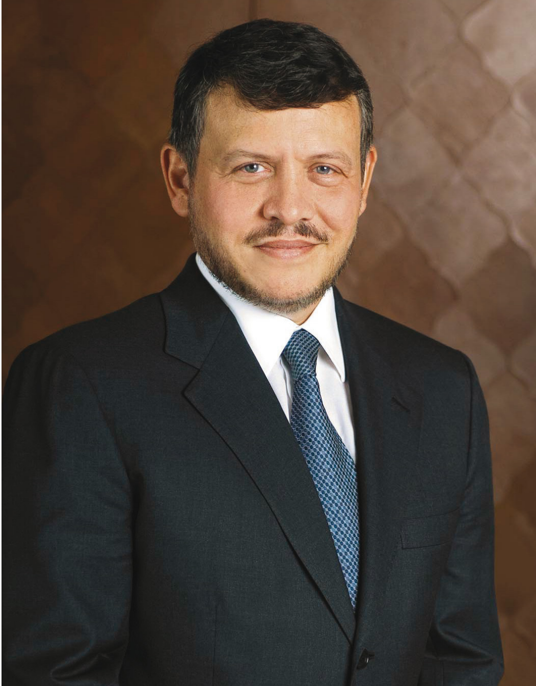
حضرة صاحب الجلالة الملك عبد الله الثاني ابن الحسين المعظم