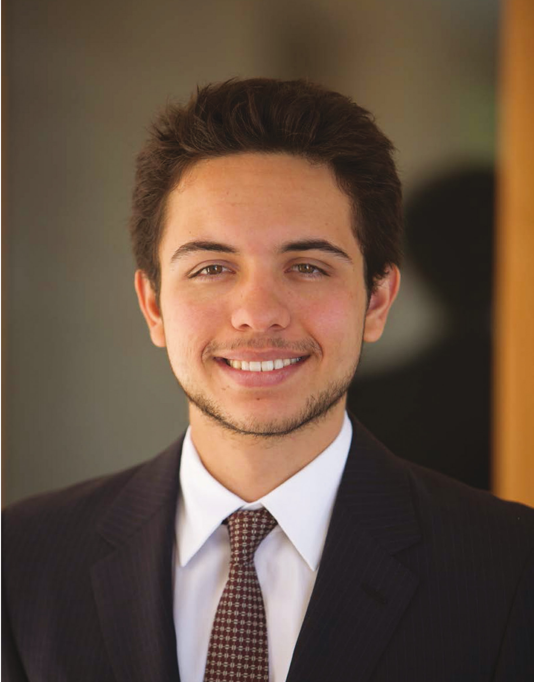
حضرة صاحب السمو الملكي الأمير الحسين بن عبد الله المعظم