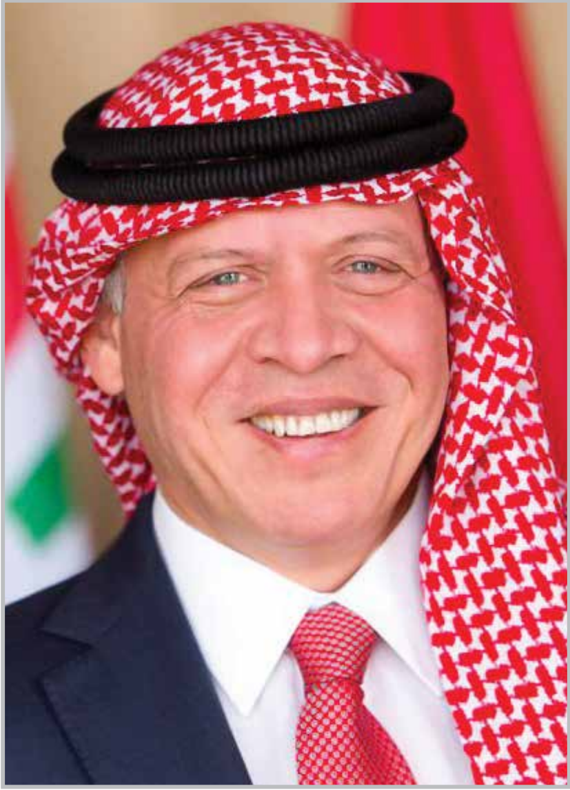
حضرة صاحب الجلالة الملك عبد الله الثاني بن الحسين المعظم