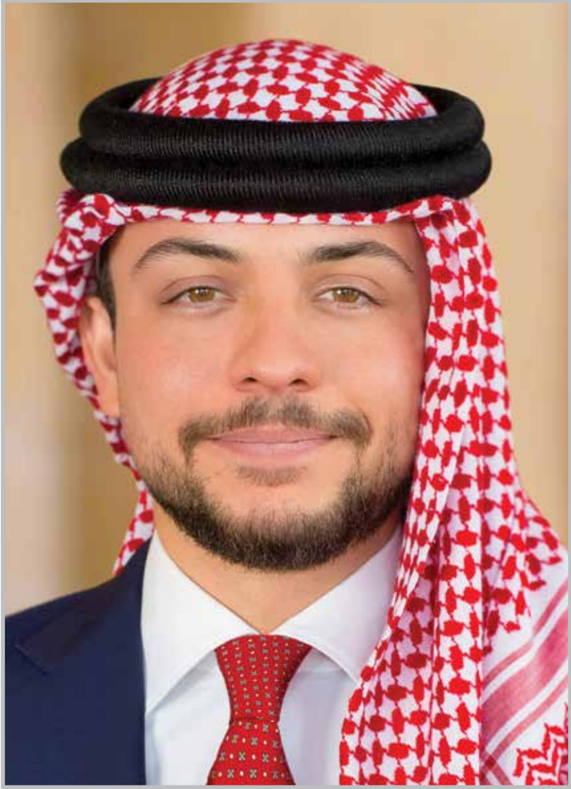
حضرة صاحب السمو الملكي ولي العهد الأمير الحسين بن عبد الله الثاني المعظم