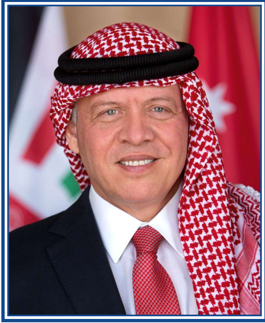
حضرة صاحب الجلالة الملك عبدالله الثاني بن الحسين المعظم