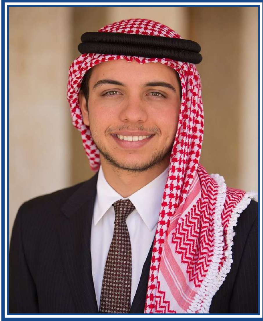
حضرة صاحب السمو الملكي الامير الحسين بن عبدالله الثاني ولي العهد المعظم