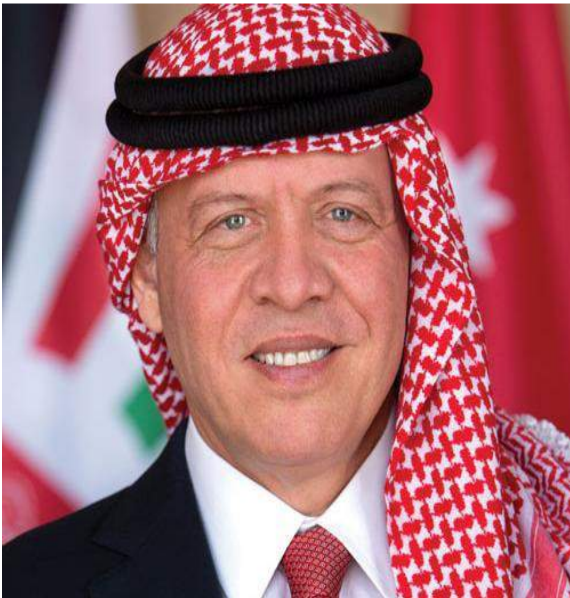
صاحب الجلالة الهاشمية الملك عبدالله الثاني بن الحسين المعظم