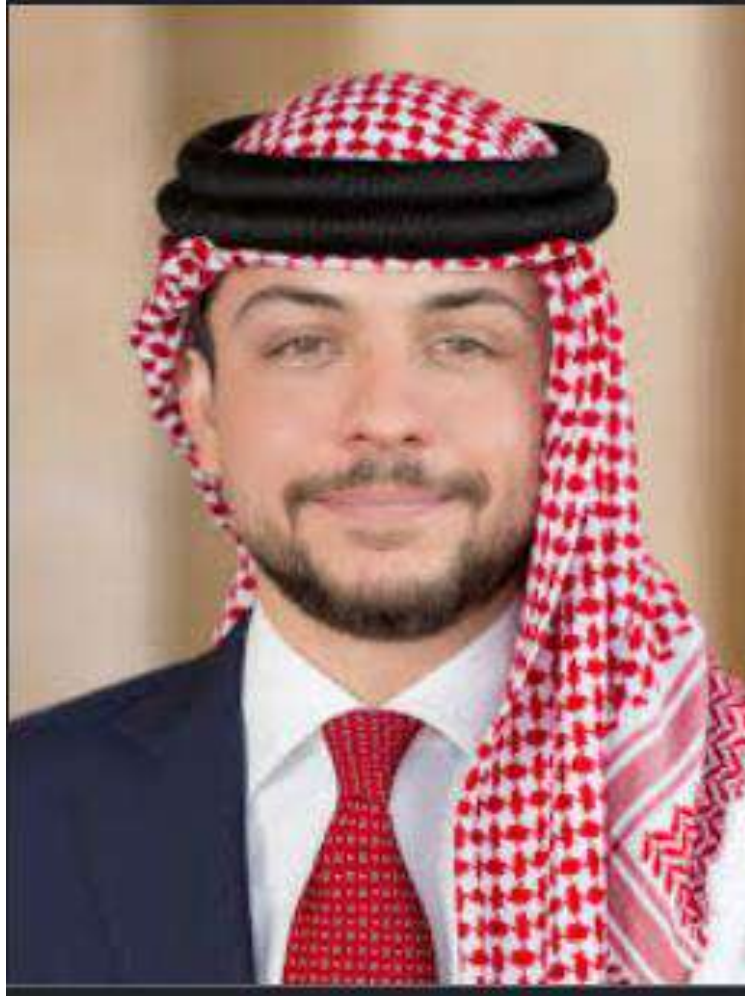
حضرة صاحب السمو الملكي الحسين بن عبد الله الثاني ولي العهد