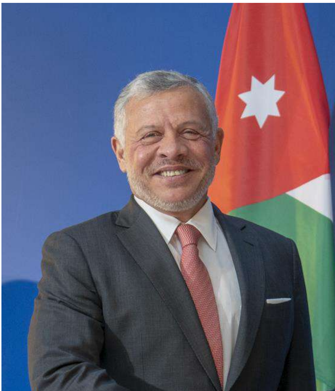
حضرة صاحب الجلالة الملك عبد الله الثاني ابن الحسين المعظم