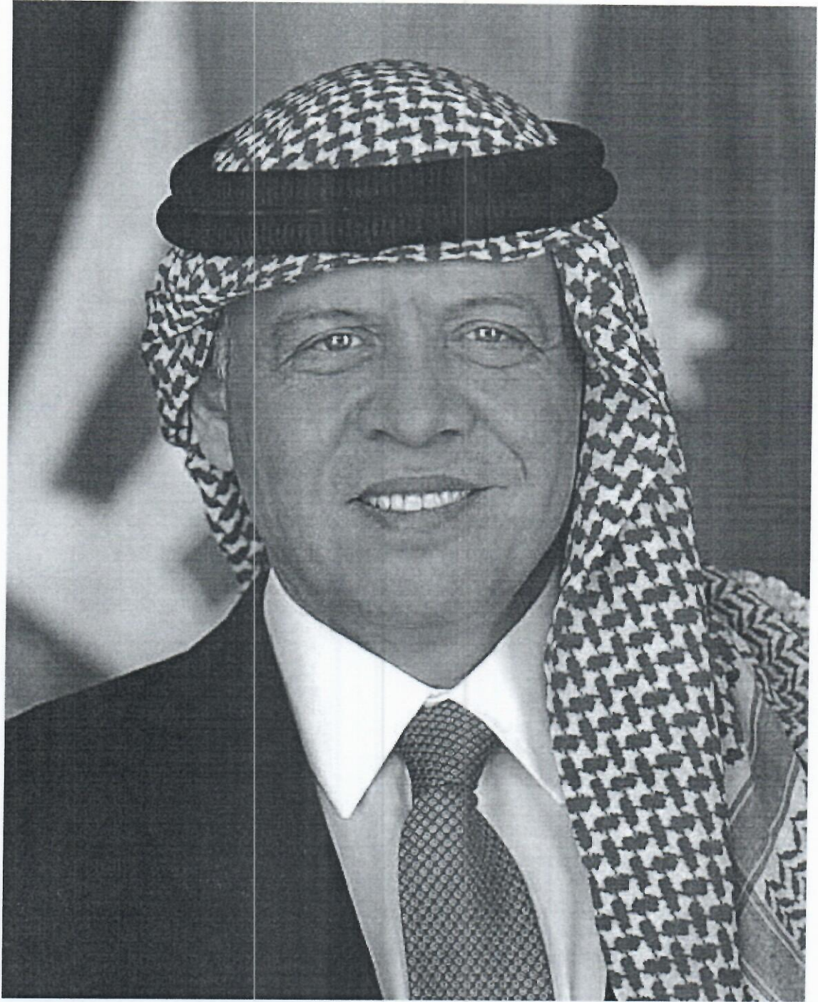
حضرة صاحب الجلالة الهاشمية الملك عبدالله الثاني بن الحسين المعظم