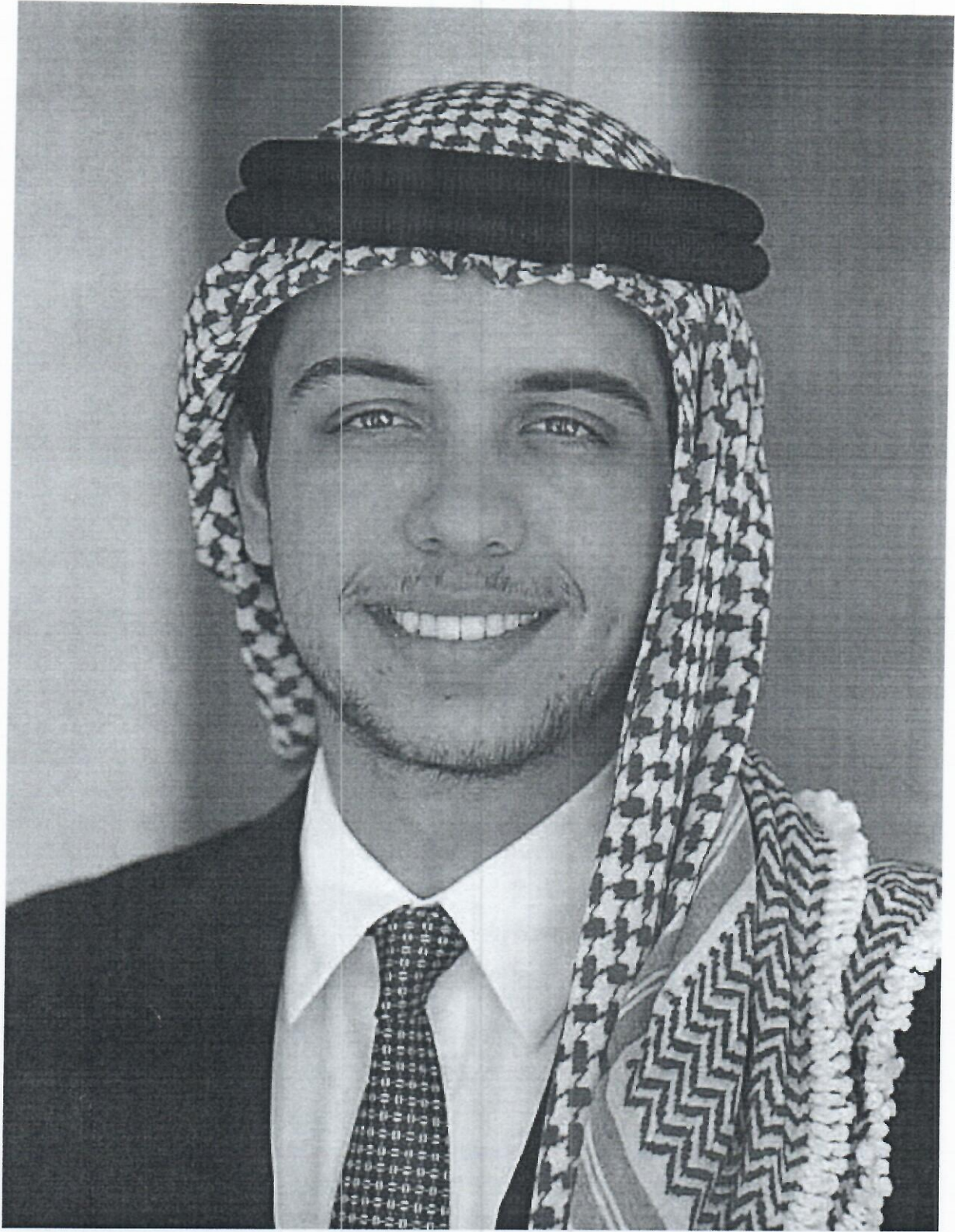
حضرة صاحب السمو الملكي الأمير الحسين بن عبدالله الثاني ولي العهد المعظم