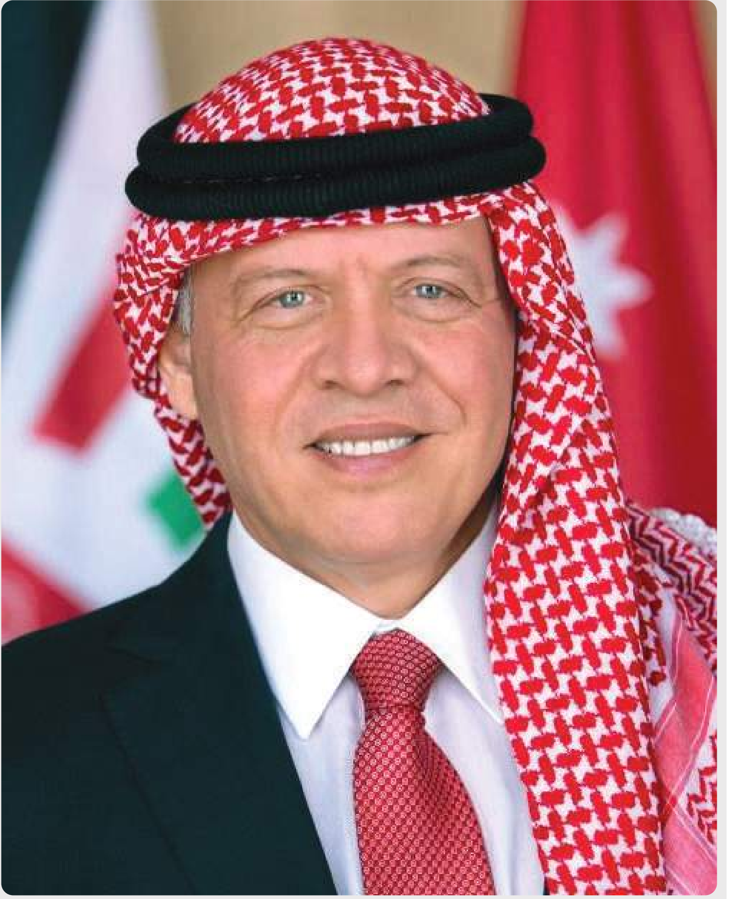
حضرة صاحب الجلالة الهاشمية الملك عبدالله ابن الحسين المعظم حفظه الله ورعاه