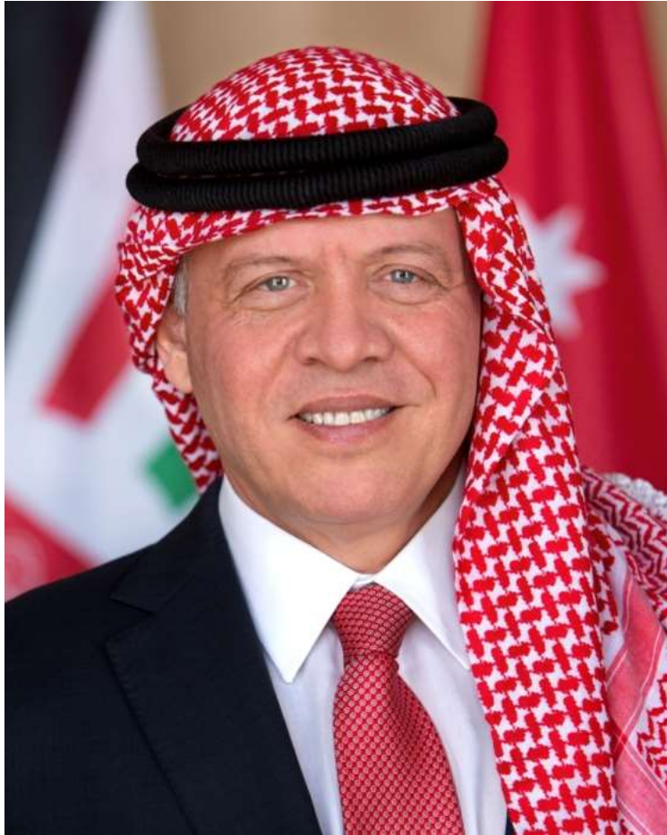
حضرة صاحب الجلالة الهاشمية الملك عبد الله الثاني ابن الحسين المعظم حفظه الله ورعاه