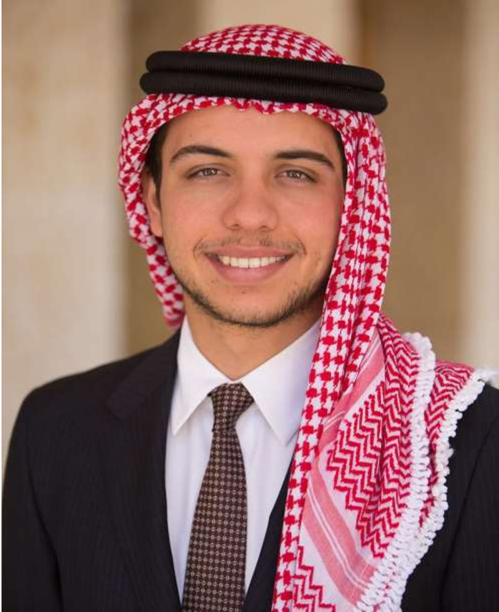
حضرة صاحب السمو الملكي الأمير حسين بن عبد الله ولي العهد حفظه الله ورعاه