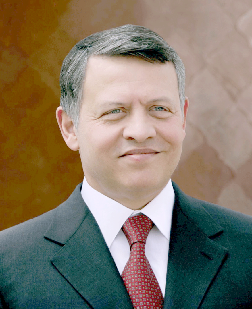
صاحب الجلالة الهاشمية الملك عبد الله الثاني ابن الحسين حفظه الله