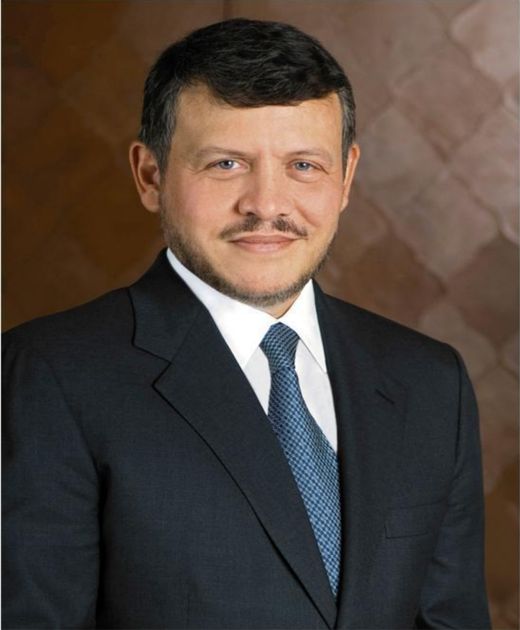
صاحب الجلالة الهاشمية الملك عبد الله الثاني ابن الحسين المعظم