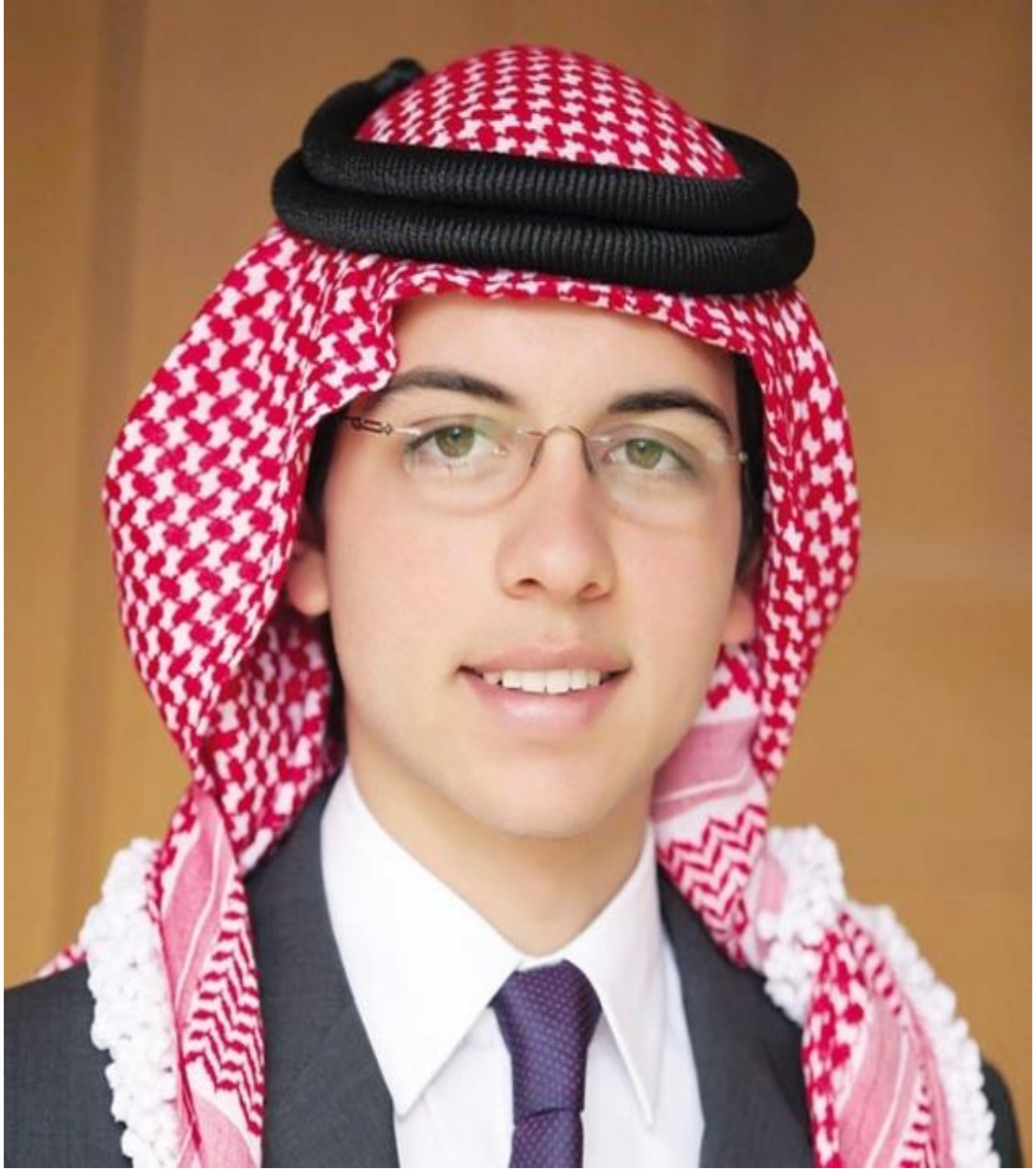
صاحب السمو الملكي الأمير الحسين ابن عبد الله الثاني ولي العهد المعظم