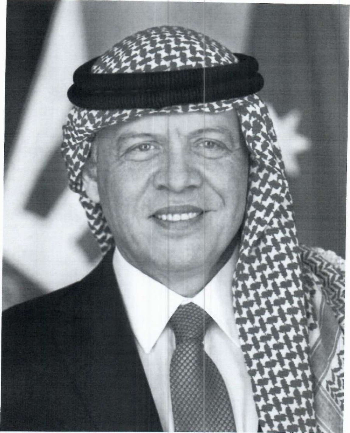
حضرة صاحب الجلالة الهاشمية الملك عبدالله الثاني بن الحسين المعظم