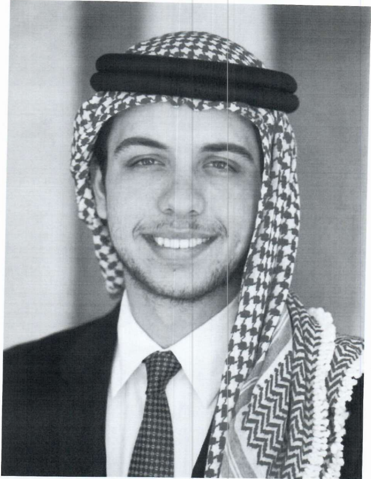
حضرة صاحب السمو الملكي الأمير الحسين بن عبدالله الثاني ولي العهد المعظم