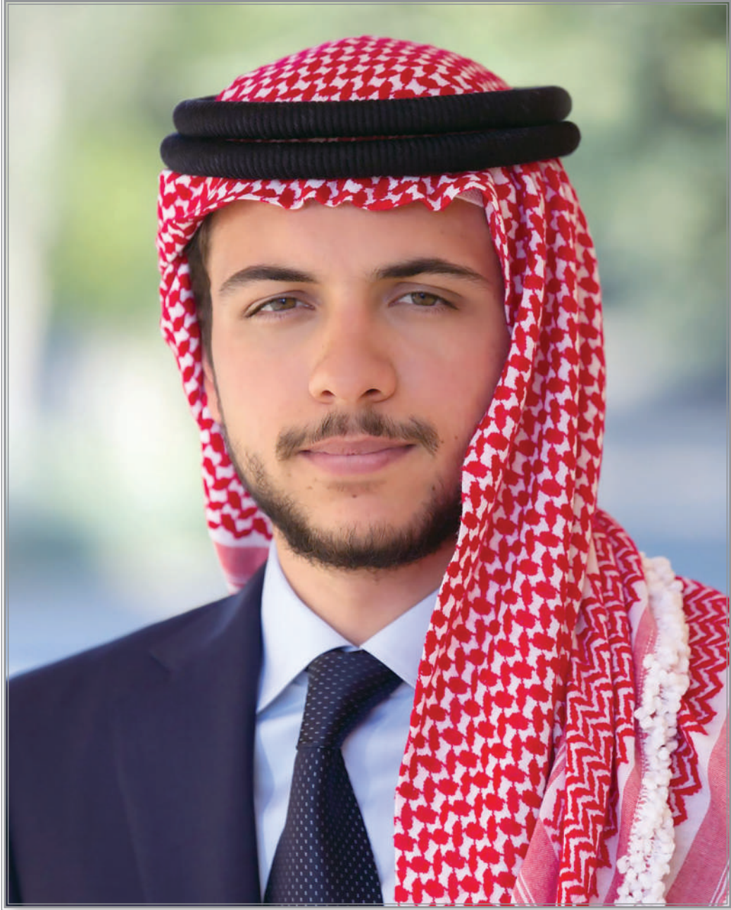
صاحب السمو الملكي الأمير الحسين ابن عبد الله الثاني ولي العهد