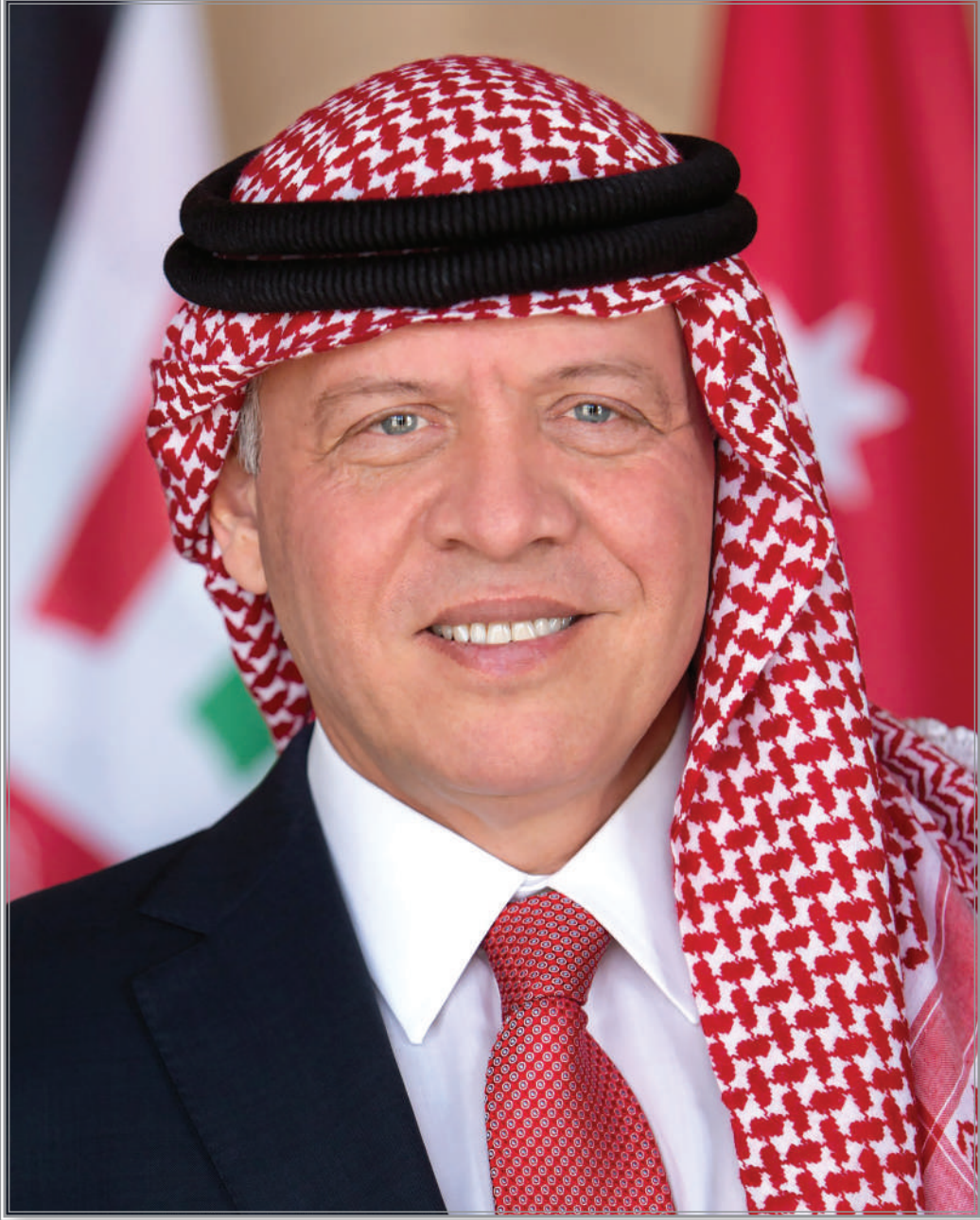
حضرة صاحب الجلالة الهاشمية الملك عبدالله الثاني ابن الحسين المعظم