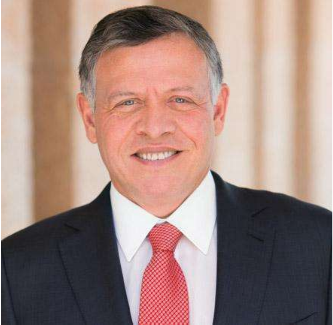
حضرة صاحب الجلالة ملك المملكة الأردنية الهاشمية عبدالله الثاني بن الحسين المعظم