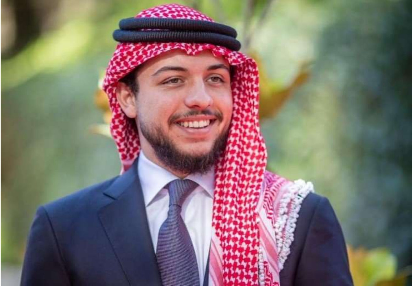
حضرة صاحب سمو الأمير الأمير الحسين بن عبدالله الثاني ولي العهد المعظم