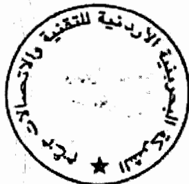
رئيس مجلس الإدارة / الشيخ محمد بن عيسى آل خليفة